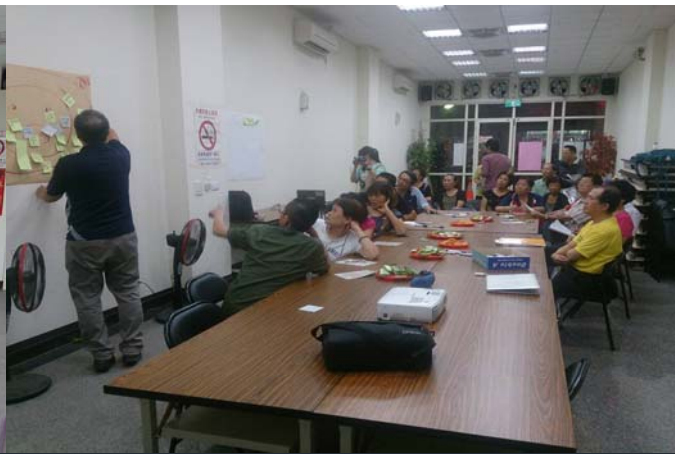
依據參與民眾的人數，設計不同的客廳座談會形式。以綠川里客廳座談會為例