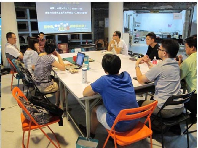
綠川工坊客廳座談會、中區居民楊氏夫婦、創世基金會